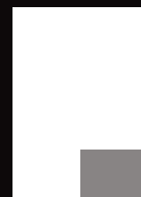
1/8 quer 100x70