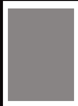
1/1 Seite 177x245