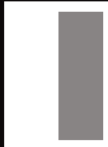
1/2 hoch 85x245