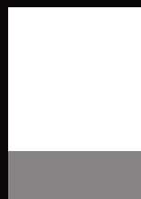
1/4 quer 200x70