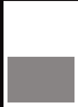
1/2 quer 177x120