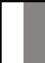
1/2 hoch 100x280